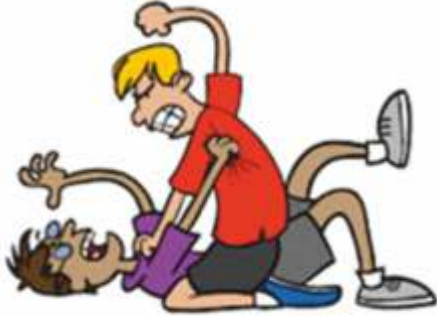
Figura 8. Diga NO a la violencia escolar