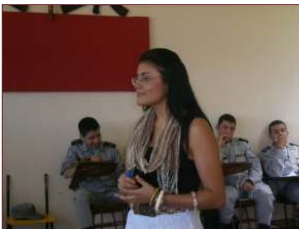
Figura 2. Taller pedagógico "violencia escolar", estudiantes del COLMILITAR.

Illegal behavior, educational measure, punitive prevention, comprehensive protection, minor