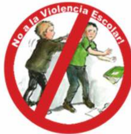
Figura 7. Adopte este logo como símbolo contra la violencia escolar

Fuente: http://uvero.adm.ula.ve/prensa/images/stories/2012/05/acoso1.jpg