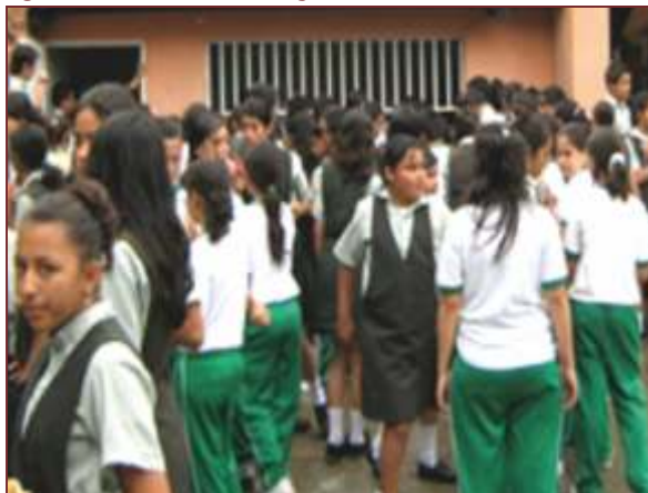
Figura 1. Estudiantes del colegio COAM

Conductas antijurídicas, medida pedagógica, menor de edad, prevención punitiva, protección integral.