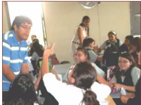
Figura 6. Integrante del Semillero de Penal, taller "Violencia Escolar", estudiantes COAM

La ley 1098 de 2006, en concordancia con otras normas sustantivas y procesales, establece como criterio rector el desarrollo armonioso del menor, que aduce a la necesaria protección integral, como pilar del desenvolvimiento cognitivo, emocional y social del ser humano. Por lo cual contempla un conjunto de disposiciones, conducentes a la corresponsabilidad o concurrencia que tiene el Estado, la sociedad y la familia, en aras a proteger, garantizar y tutelar el ejercicio responsable de los bienes jurídicos de los menores. En concordancia con el plexo jurídico constitucional, cabe señalar que los derechos fundamentales de los menores serán protegidos contra todo factor de detrimento o riesgo, la familia como núcleo esencial de la sociedad y el Estado, tienen a cargo la responsabilidad de asistirlos,