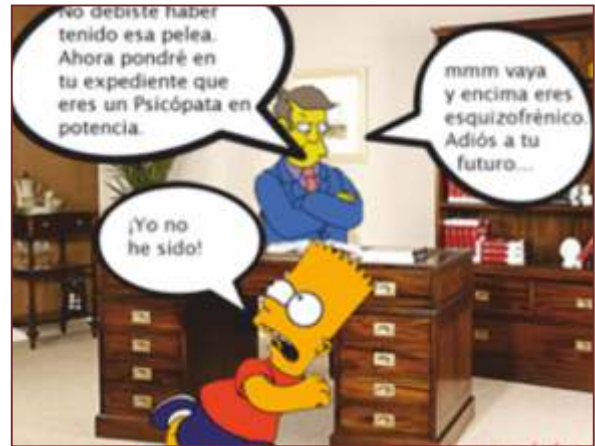
Figura 9. Como influyen los medios de comunicación en los menores de edad