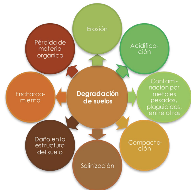
Figura 1. Las implicaciones de la degradación de los suelos.

De igual manera, la degradación de los suelos implica una disminución o alteración negativa de sus servicios y funciones ecosistémicas y ambientales (figura 1), las cuales pueden ser de tipo físico, químico o biológico. En la degradación física se destacan la erosión, la compactación [15] y la pérdida de la calidad de la estructura del suelo, que afecta de manera directa la filtración del agua y, en cambio, favorece la escorrentía y el arrastre de partículas finas, como la materia orgánica [13].