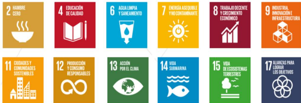
Gráfico 2. ODS de la Agenda 2030 con perspectiva de cumplimiento en Ecuador

En varios estudios, se destaca que a pesar de ser la economía circular (Figura 3) un concepto nuevo y no contar con cifras exactas de la cantidad de empresas ecuatorianas que la aplican, existe evidencia de unas pocas que “han asumido su responsabilidad social e independientemente han tomado compromisos que van más allá de políticas y han comenzado a incrementar los niveles de protección al medioambiente”(Garabiza et al., 2021). En opinión de Rodríguez, Mosquera y Vega (2022), “para adoptar el modelo de una Economía Circular el país tiene como visión un principio que trata de potenciar iniciativas, recoger y reincorporar aquellos residuos energéticos y materiales a cadenas de valor para poder minimizar los desechos; se pretende así poder cambiar el sistema de economía tradicional”.