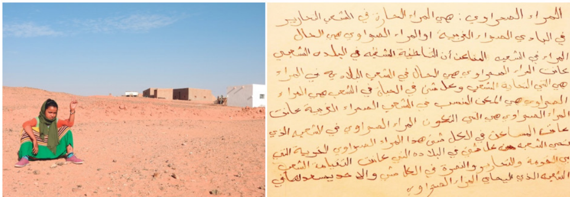
Figura 3. Muestra de la fotoelicitación Campamento Tinduf.

Además, se percibe un especial interés por resaltar el papel de la mujer en los campamentos con expresiones como: “la mujer saharai ayuda a su pueblo, ella quiere la libertad para su país, es una mujer fuerte, su ropa le enseña su libertad, hace su trabajo bien hecho, cuida a sus hijos sola no necesita ayuda” (Embarka, mayo10 de 2017). El gesto con la mano que está haciendo Embarka es uno de los símbolos de la lucha saharai.