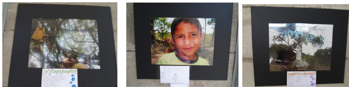
Figura 1. Exposición fotográfica en albergue.

Finalmente, las fotografías tituladas “Resiliencia gramalotera” y “La aparecida” hacen referencia a las fuertes creencias católicas del pueblo y como estas creencias son importantes para los más jóvenes, posiblemente como una forma para entender y sobrellevar sus realidades.