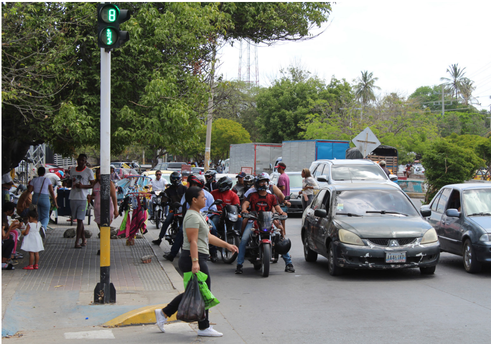
Imagen 2. Jóvenes migrantes limpiavidrios en la actividad