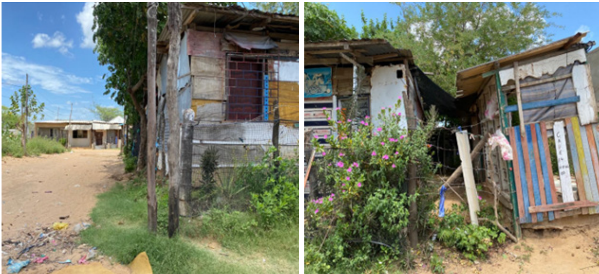
Imagen 4. Los “cambuches” imágenes de viviendas donde residen los inmigrantes

“... con mis compañeros, si no tienen una moneda, están asfixiados peleamos, es difícil ”. ET6