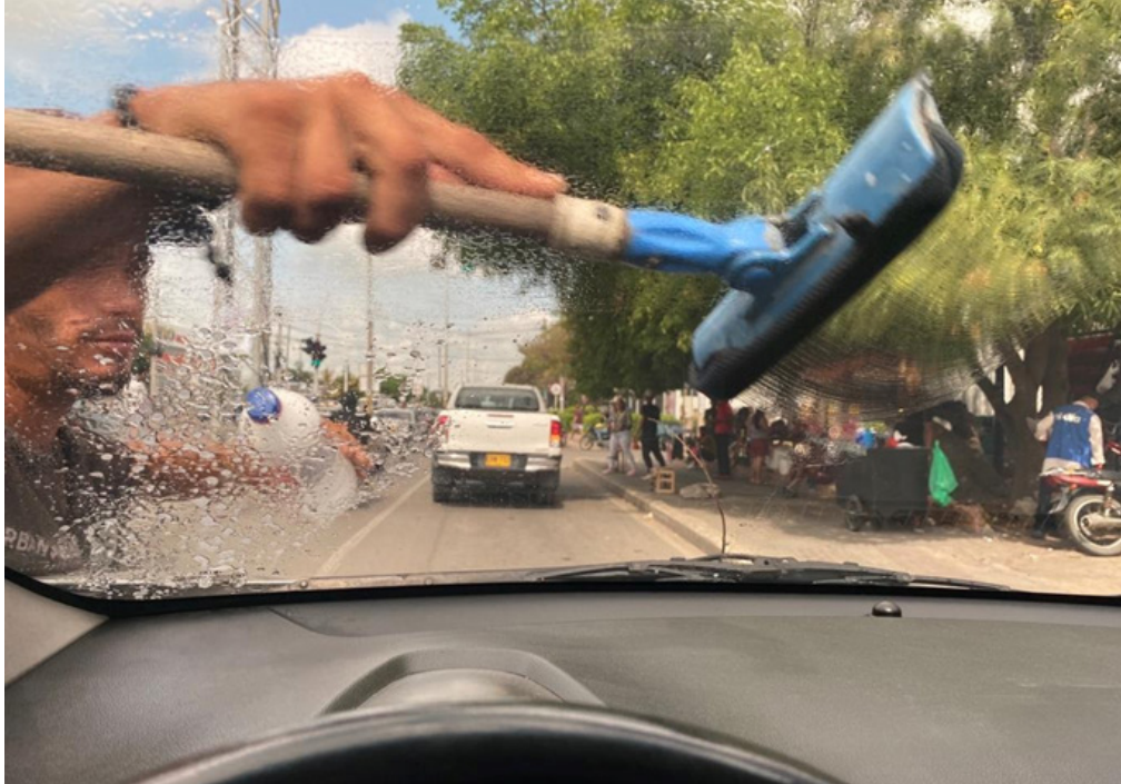
Imagen 1. Joven migrante limpiavidrios en el cruce de cuatro vías (Riohacha)