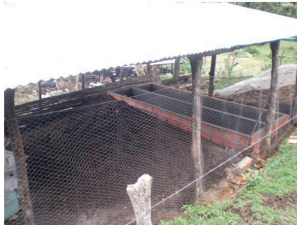
Figura 4. Ejemplo de instalación para lombricultivo.

El sistema de riego para este cultivo es manual, con manguera de goma, lo que evita el encharcamiento. El alimento orgánico es variado y se compone de restos de serrería al cortar la madera, desperdicios de matadero, residuos vegetales o agrícolas, estiércol de especies domésticas, frutas, tubérculos y basuras orgánicas en general. La lombricultura puede realizarse en terrazas o jardines, en cajones de madera o polietileno (con orificios en el fondo), lo que permite una producción continua de compost. Para esto se colocan las lombrices en un extremo del cajón y se le suministra a diario alimento, cubriendo los residuos con una capa de tierra a fin de evitar la presencia de moscas y otros insectos. Saturado el primer cajón se empieza otro empleando para la siembra ejemplares del primer cajón. Los cajones deben estar protegidos del sol y de la voracidad de los pájaros. El compost resultante se conserva en recipientes y las lombrices extraídas sirven para iniciar nuevos cajones, harina, pesca, etc. Puede almacenarse por mucho tiempo sin que sus propiedades se alteren si se mantiene bajo condiciones óptimas de humedad (véase el ejemplo en la figura 4).