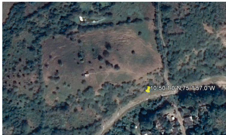
Figura 1. Ubicación del predio para el diseño de granja autosostenible.