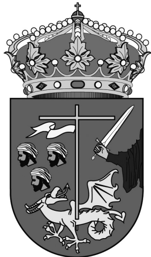
Figura 3. Escudo heráldico del ayuntamiento de San Millán de la Cogolla, la Rioja

San Millán de la Cogolla (La Rioja), pueblo ubicado en la misma comarca riojana, adoptó también un escudo de armas con unas características muy similares a las anteriores y, en ese caso, además, presidido por una cruz católica apoyada por una espada.