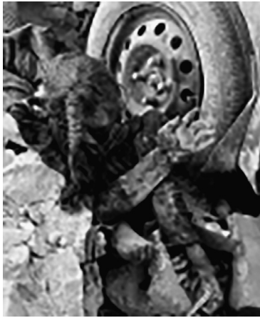
Figura 1. Lee de lo que nunca fue escrito, ignorada por los medios occidentales, de una niña fumigada 10 por la operación inherent resolve. Mosul, Iraq, 2017 11 .